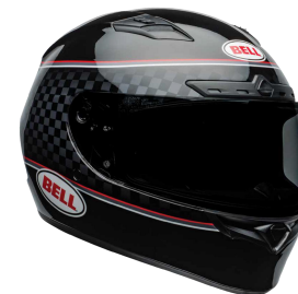
QUALIFIER DLX MIPS