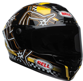
STAR DLX MIPS