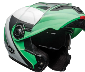
SRT - MODULAR