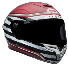
RACE STAR FLEX DLX